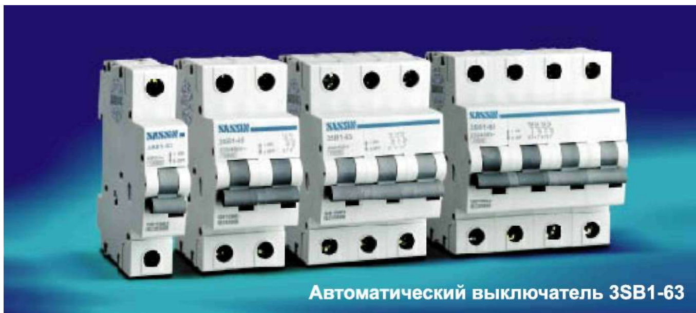
Автоматический выключатель 3SB1-63